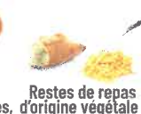
Restes de repas d'origine végétale : pâtes, riz, pain