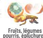
Fruits, légumes pourris, épluchures, Coquilles d'œufs