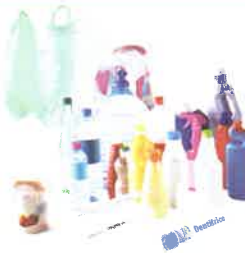
Tous les emballages plastiques