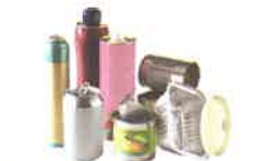
Tous les emballages métalliques