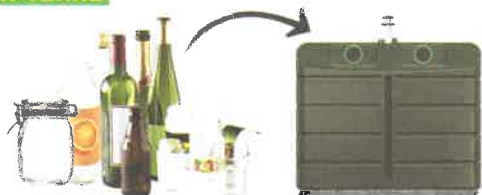
Bouteilles, pots et bocaux en verre